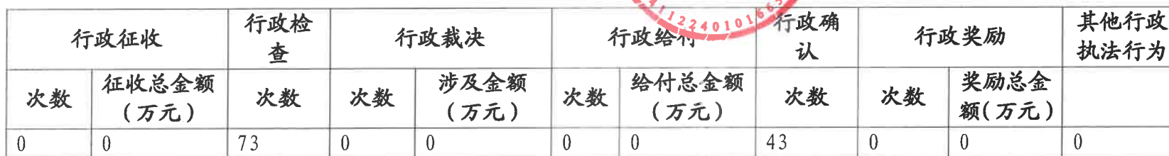
卢氏县人力资源和社会保障局 2022 年度其他行政执法行为实施情况统计表