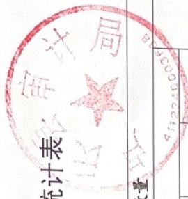
卢氏县审计局 2022 年度行政强制实施情况统计表