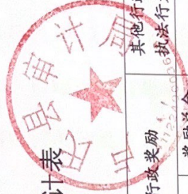
卢氏县审计局 2022 年度其他行政执法行为实施情况统计表