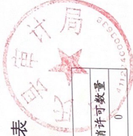
卢氏县审计局 2022 年度行政许可实施情况统计表